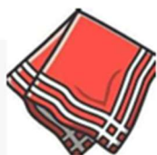
Une serviette de table