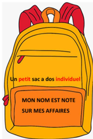
Un petit sac à dos individuel